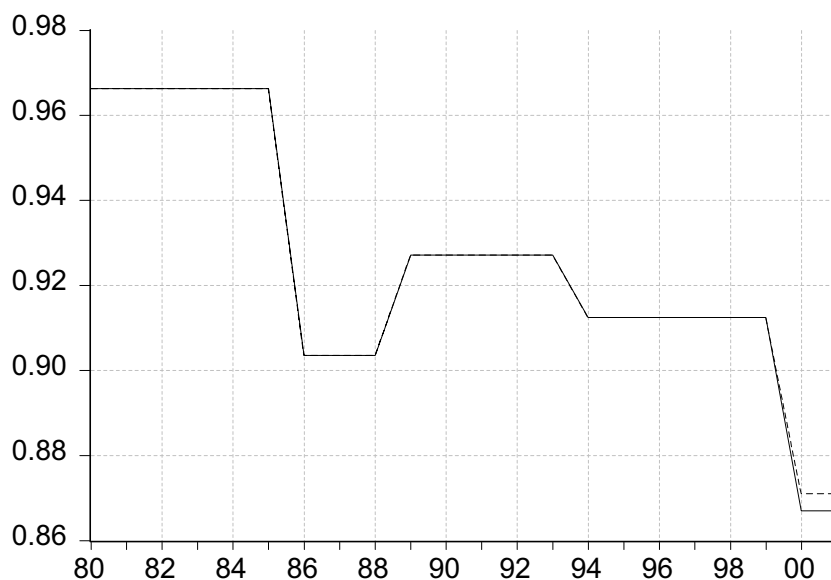
Abbildung 3: Generosität des Forschungsfreibetrags: B-Index 1980 –2000